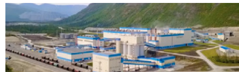
Северо-Западная Фосфорная Компания

ООО «Энергокомплект», 614064, Пермь, Героев Хасана, дом 46, литера Ф, офис 406 ИНН 5906098467, КПП 590401001