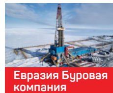
Евразия Буровая компания

Москва, Санкт-Петербург, Пермь, ХМАО, ЯНАО, Республика Коми, Республика Татарстан, Краснодарский край, Екатеринбург, Сахалинская область, Приморский край, Астраханская область, Брянская область, Тюменская область, Нижегородская область, Псковская область, Самарская область, Рязанская область, Республика Башкортостан, Хабаровский край