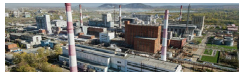
Башкирская содовая компания

8 (342) 215-36-96 office@energocomplect.com www.energocomplect.com